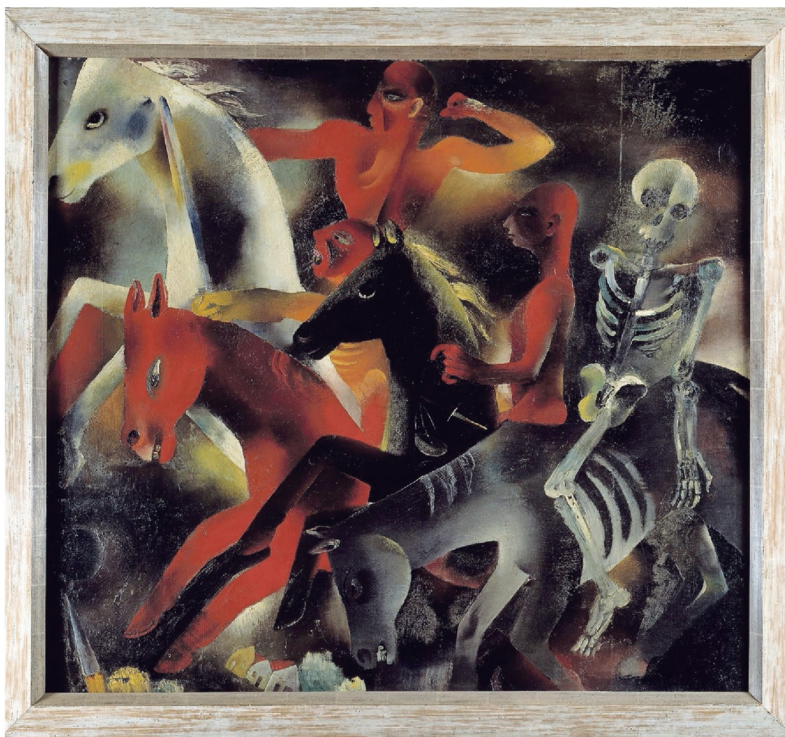
Tinus van Doorn: Apocalyptische ruiters (1932) .